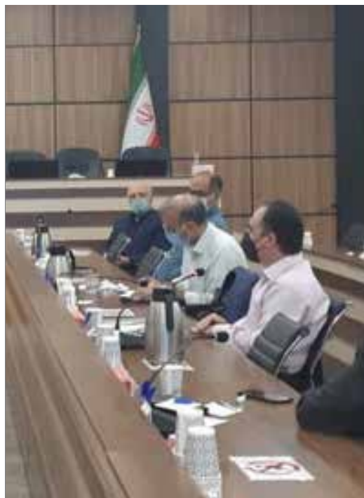
انتخابات داخلی هیئت مدیره کانون هماهنگی دانش صنعت و بازار صنعت طیور

کانون هماهنگی دانش صنعت و بازار صنعت طیور بر اساس رهنمودهای مقام معظم رهبری با هدف تقویت ارتباط صنعت و مراکز علمی، پژوهشی و فناوری با نیل به اهداف توسعه اقتصادی به ویژه سیاست‌های کلی تولید ملی، حمایت از کار و سرمایه ایرانی، مصوب سی امین جلسه مورخ ۱۵ / ۱۲ / ۱۳۹۱ ستاد راهبری نقشه جامع علمی کشور تاسیس شد.